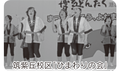
筑紫丘校区「ひまわりの会」

「博多どんたく南区演舞台」が5月4日(月)に、大橋駅西口広場で開催され、南区シニア連からは2チームが出演しました。筑紫丘校区のひまわりの会が「九ちゃん音頭」と「可愛いバーバ」を、また若久校区の楽しいコーラスが「私の好きなこの町」と「歓びの歌」を披露し、会場を大いに沸かせました。