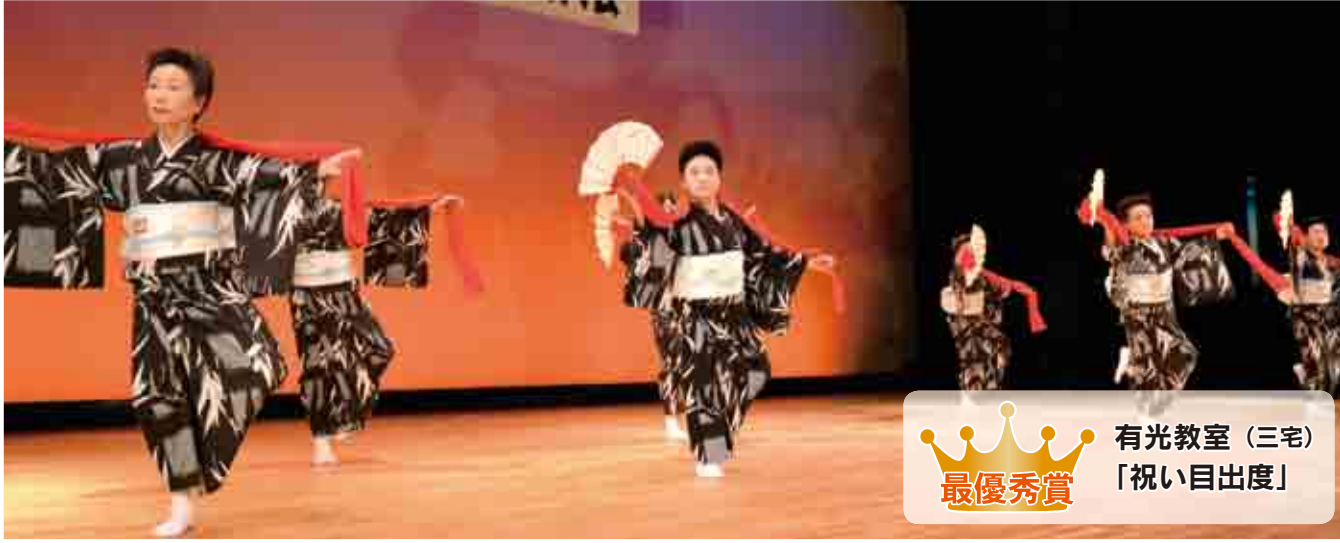
有光教室 (三宅) 「祝い目出度」 最優秀賞