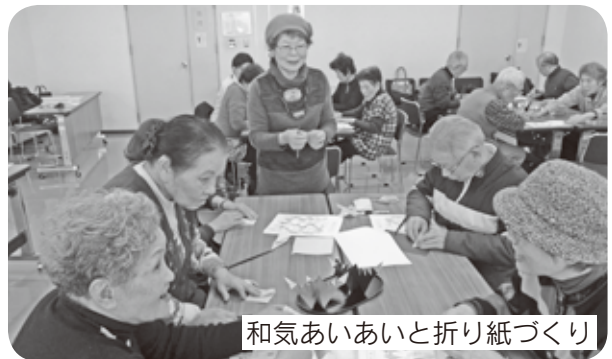
和気あいあいと折り紙づくり