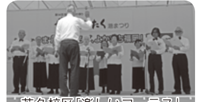
若久校区「楽しいコーラス」

「はいったる!!」「ナイスショット!」シニアスポーツの代名詞、グラウンド・ゴルフ大会で聞こえてくる声。ホールインワンの時は周りの方も手を止め「すごかー」と祝福。「練習でも入ったことがなかったのに」と満面の笑み。こんな光景を取材先でよく見かけます。私は南区シニア連だよりをはじめ全国各地の老人クラブの広報紙の取材に行きますが、いつも決まって笑顔と笑い声が絶えません。