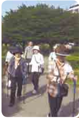
長い距離も快適に歩けます

を使って歩くことから、膝や腰の負担が減り、体力向上、肥満防止や姿勢の改善が期待でき「こりやー調子が良か。少し若うなっただい」と好評でした。