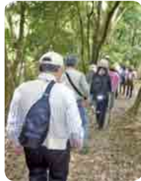
自分のペースで楽しく山登り

た。柏原3丁目登山口から片縄山山頂(292m)を往復し、森林浴を楽しみながら、自らの健康づくりに生かそうと毎月1回のペースで実施しています。また