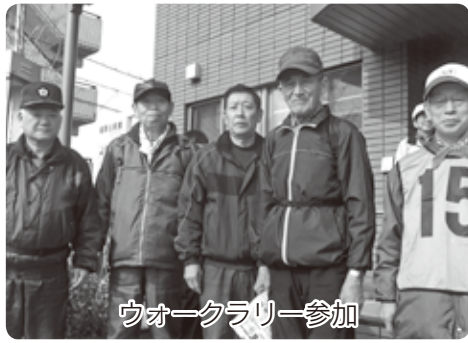
ウォークラリー参加

4年ほど前まであったシニアクラブをなんとか復活させようと、地元校区連の力強い後押しもあり、チラシなどの呼びかけで会員32名を集めることができました。まずは、会員の皆さんが無理なく参加できるよう、清掃、祭り、ウォーキング、防犯などに取り組み、徐々に活動の輪を広げていきたいと思ひます。