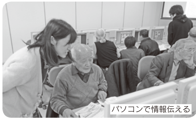
パソコンで情報伝える

今回投稿したものは「南区シニアクラブ連合会」のフェイスブックに掲載しています。皆さん、ぜひ、私たちの出来具合を見て下さい。