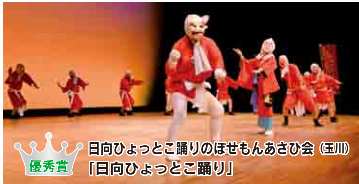
日向ひよつとこ踊りのほせもんあさひ会 (玉川) 「日向ひよつとこ踊り」 優秀賞

7月3日(金)、南市民センター・文化ホールにて、南区シニア演芸大会が盛大に開催されました。出場した28組273名は創意工夫を凝らした見応えある演技を披露。客席からは拍手に加え、歓声や熱視線が飛び、大変盛り上がりました。