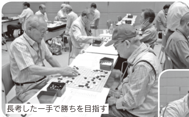
長考した一手で勝ちを目指す