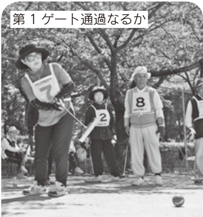
第1ゲート通過なるか

新緑まぶしい5月19日(火)、南体育館・運動広場で、ゲートボール大会が開催され、3チームが出場し市老連大会へ